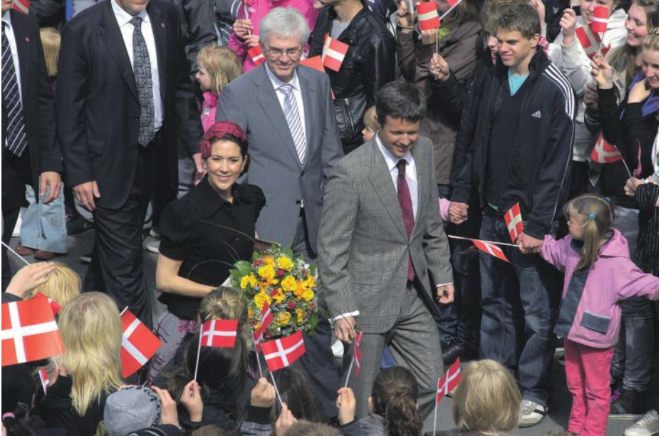
Kronprinsparret besøger Duborg-Skolen i maj 2009.

Det er glædeligt, at mange besøgsgrupper virkelig værdsætter skolens og især vore elevers indsats og viser dette med gaver og ofte med en efterfølgende feed-back: